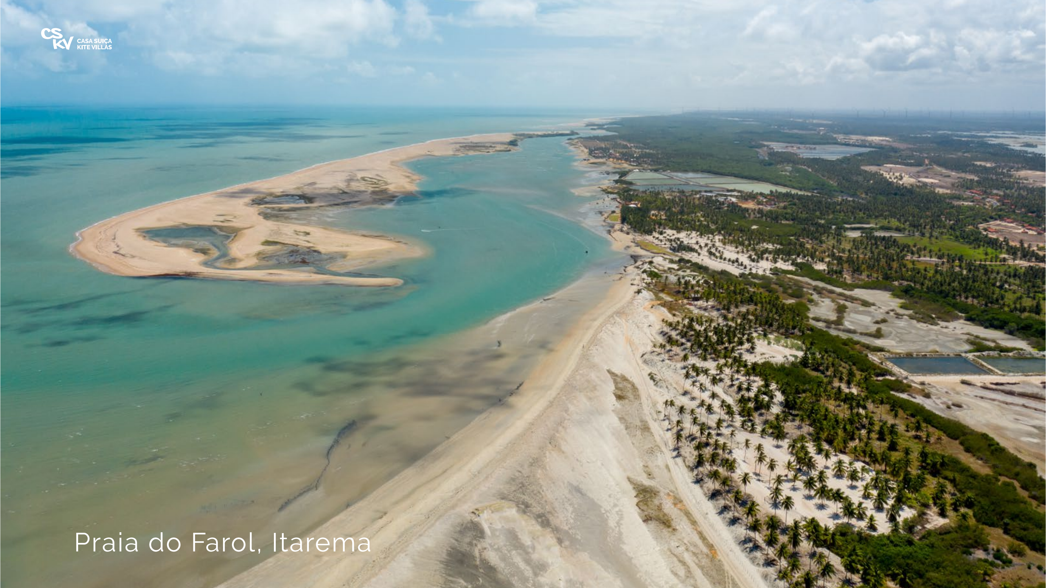
Praia do Farol, Itarema